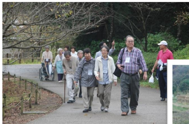
自然を楽しみながら歩く

内容:山崎・谷戸の会の協力で鎌倉中央公園を案内してもらいながら歩きました。その後休憩舎でサツマイモをふかしておやつに食べながら交流を深めました。認知症の人や家族、介護職、市民など、20名が参加しました。