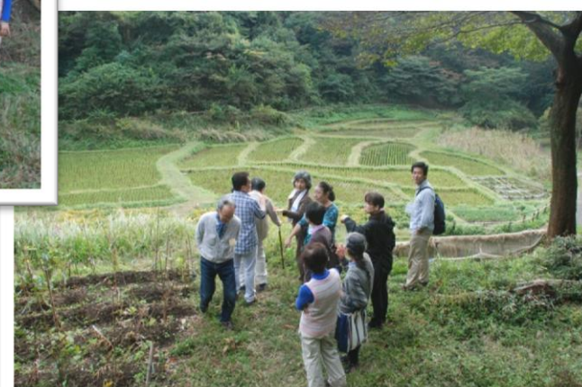
丘の上って景色を楽しむ