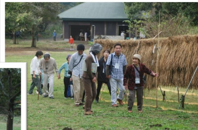
稲刈りの後の景色を楽しむ